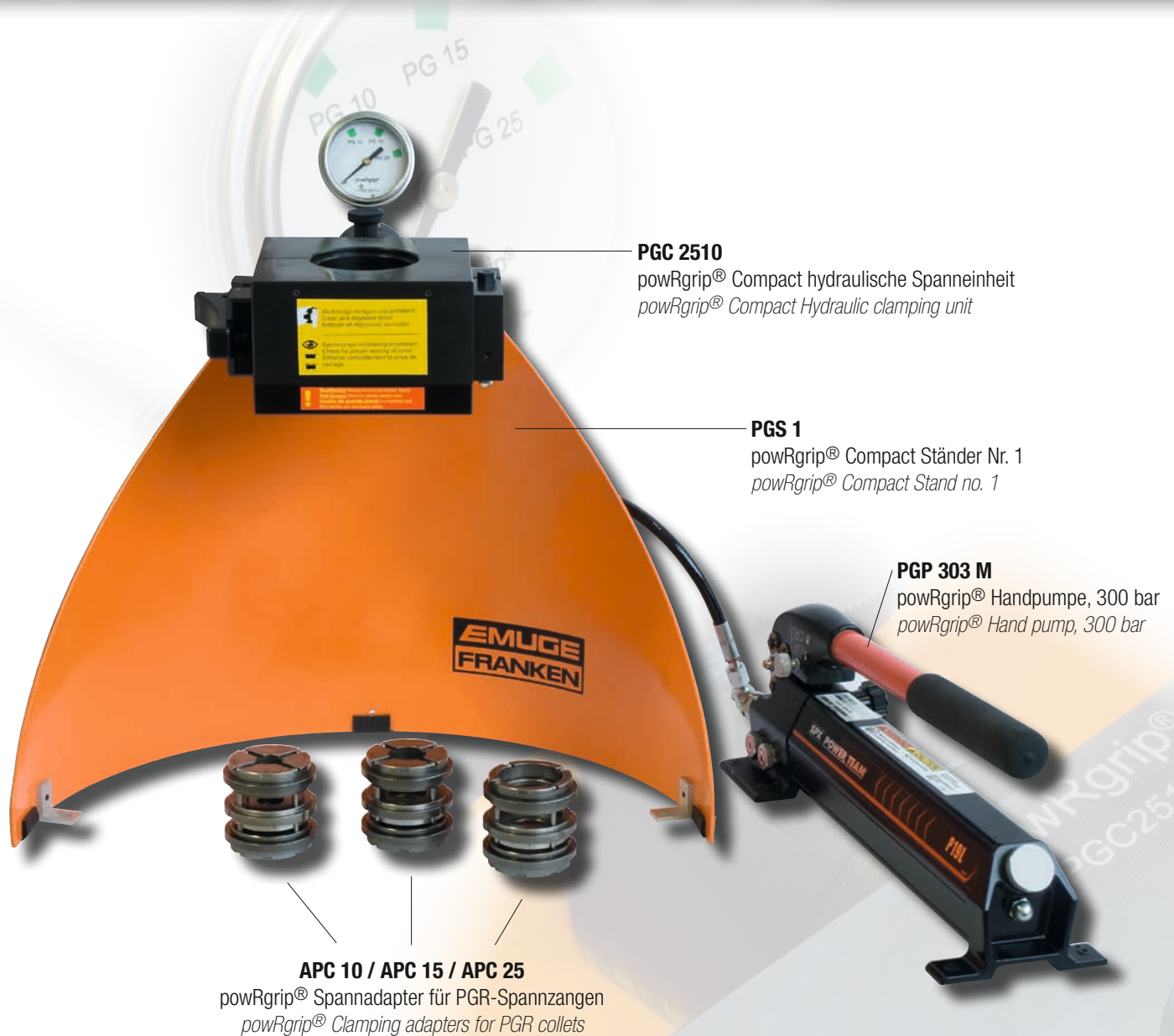
PGC 2510 powRgrip® Compact hydraulische Spanneinheit powRgrip® Compact Hydraulic clamping unit